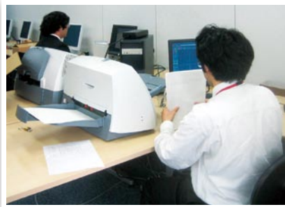
● カルテ電子化突貫工事作業