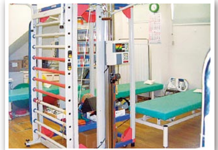
● 突貫工事により生まれ変わった元カルテ室 (現在はリハビリ室)

※個人情報保護法、e-文書法ご対応に関するご相談もご遠慮なくお申し付けください。